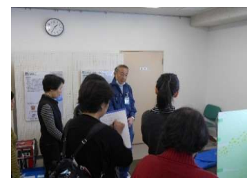
防災ワークショップ