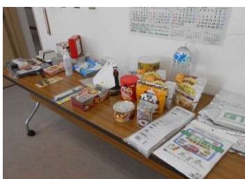
災害時の保存食など