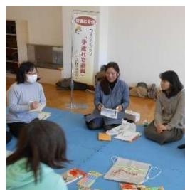
参加者ディスカッション