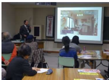
防災学習センター所長の講和