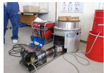
炊き出し用具の展示