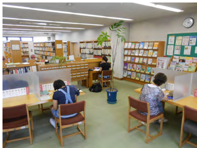
9席の閲覧席はどなたでもご利用できます。

開催 年6回（次回9月19日（木）） （今年度は9月以降、11月、1月、3月に実施を予定） 場所 2階 図書・資料室 対象 1歳以上の幼児を育てている保護者 定員 6名 申込方法 電話にて先着順