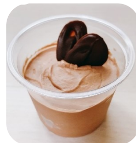
チョココース見本